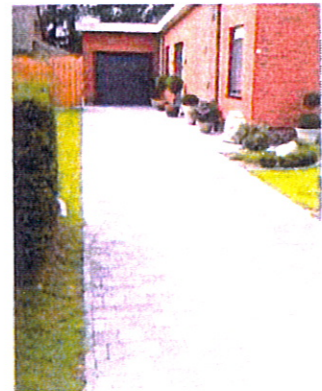
Pavage Gris noir en 15*15*6