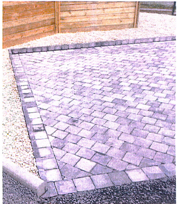
Pavage Gris noir en 15*15*6