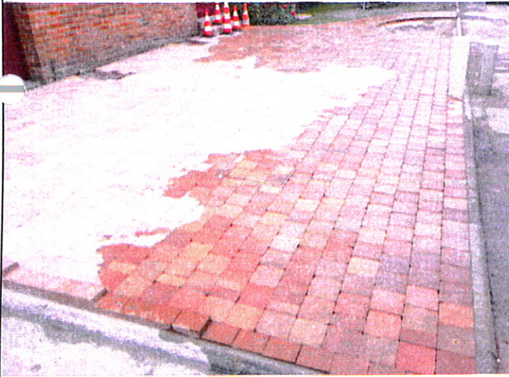
Pavage Rosé-rouge en 15*15*6