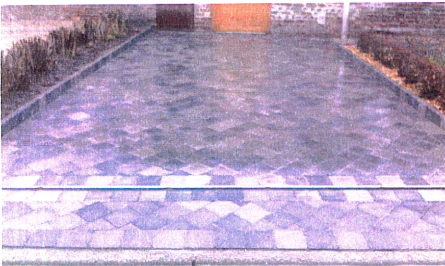
Pavage Gris noir en 15*15*6